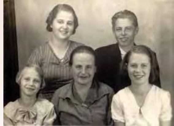
Eftersom pappan var på sjukhus långa tider tog mamman ofta ensam om familjen