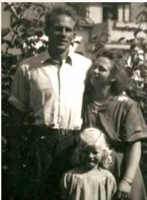
Hon flyttade till Gotland, gick på bibelskola. Där fanns där en lång och stilig karl att förälskade sig i. (flickan är ett finskt krigs-barn)