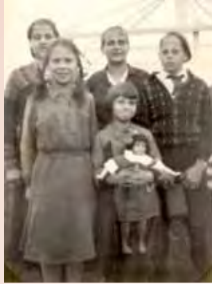
Hennes käraste sak var en docka - och dockor älskade hon livet ut