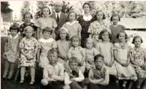
I skolan trivdes hon inte så värst - lärarna var stränga och klasskamraterna retades

Men även trista saker har ett slut, och snart var hon en söt tonåring med aptit på livet.